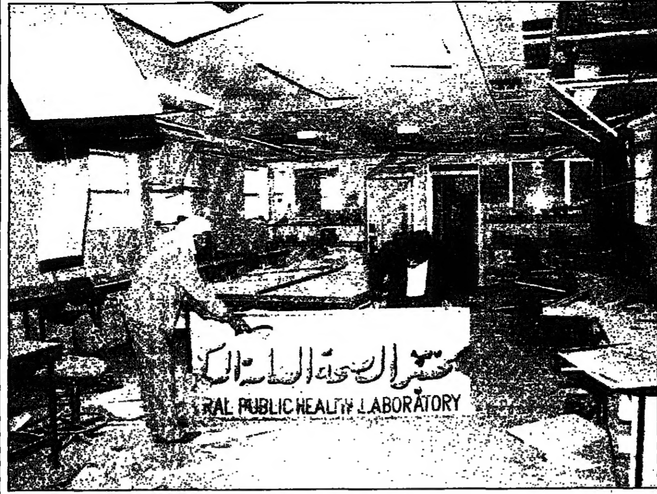
أثار الدمار الذي خلفه الهجوم على مقر «مجاهدي خلق» في بغداد

الكويت - رويترز - قال مسؤول إيراني في تصريحات نشرت امس ان إيران لا تتوقع من الولايات المتحدة ان تسمى بواجبها عسكريا معها لان هذا من شأنه تهديد صادرات النفط من المنطقة.